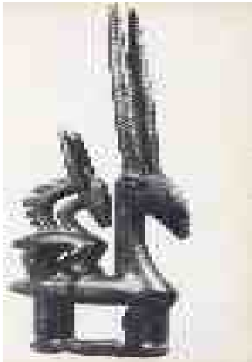
Maschera chi-wara, antilope femmina con piccolo sul dorso, .stile segu, mali, cultura bambara, ap 26