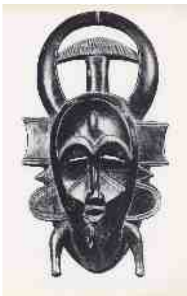
Maschera sakrobundu costa d'avorio, cultura senufo, ap 60