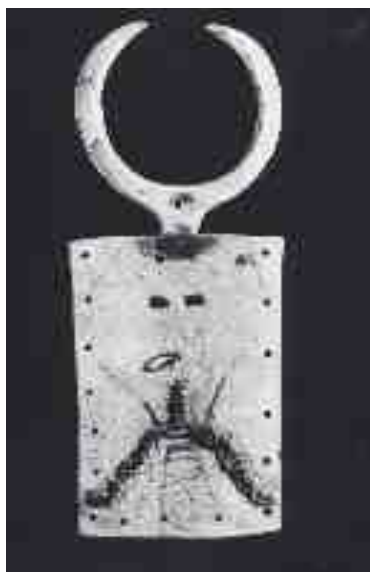
Maschera per cerimonie notturne di purificazione ghana, cultura bron, ap 104