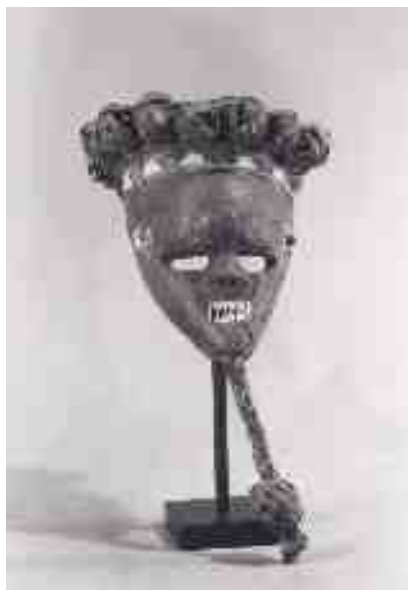
Maschera con fibre vegetali zaire, cultura salampasu, ap 216