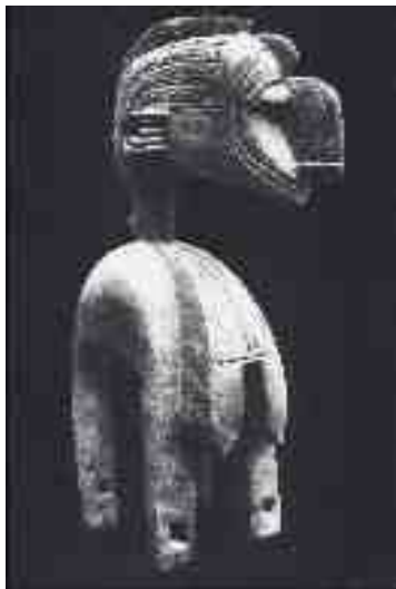
Nimba, grande maschera simbolo di fecondita guinea, cultura бага, ap 48