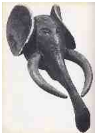
Maschera-elefante legata al culto dei morti camerun, cultura bali, ap 150