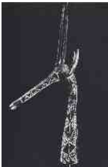
Grande testa lignea di antilope alto volta, cultura kurumba, ap 40