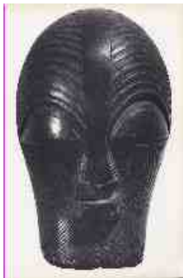
Maschera kifwebe con influsso lubazaire, cultura songe, ap 207