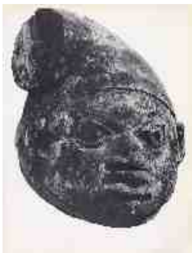
Maschera della societa' segreta "gelede" nigeria, cultura yoruba, ap 127