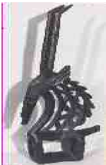
Maschera chi-wara, antilope con criniera frastagliata. stile segu, mali, culturabambara, ap 27