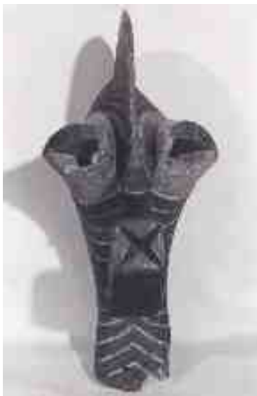
Maschera kifwebe zaire, cultura songe, ap 206