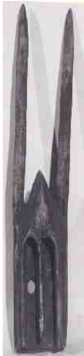
Maschera-antilope di uso funerario, detta walu, mali, cultura dogon, ap 19