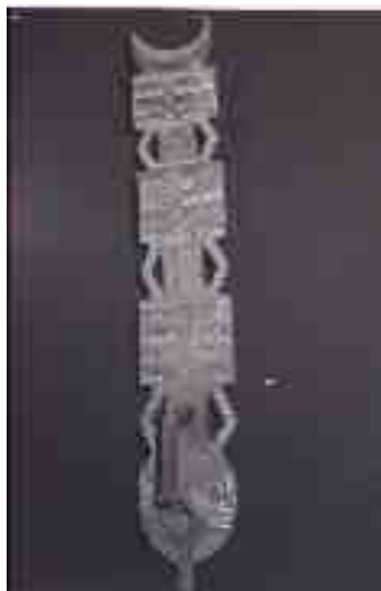
Maschera Di Do spitiri tutelari del villaggio alto volta, cultura bobo, ap 46