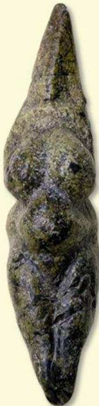
“Venere di Savignano” Palcolitico superiore. 28.000-24.000 anni fa.

La “Venere di Savignano”, recuperata nel 1925, è stata datata sulla base di confronti stilistici con numerose statuette femminili trovate in varie parti d’Europa. I grandi glutei, il seno, le cosce, il ventre sono realizzati con forte senso plastico che testimonia il particolare interesse di queste popolazioni per la riproduzione e la fertilità.